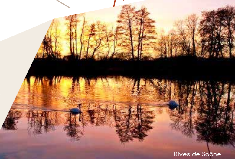
Rives de Saône