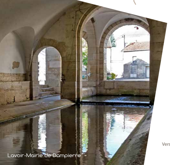
Lavoir-Mairie de Dampierre