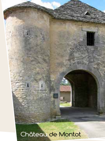
Château de Montot