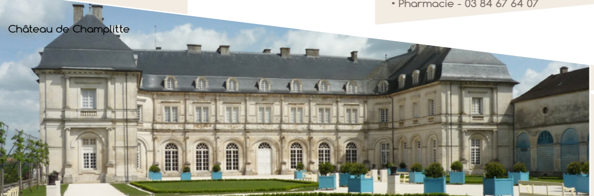
Château de Champlitte

Contact Office de Tourisme Région de Champlitte 2, Allée du Sainfoin 70600 Champlitte 03 84 67 67 19 ot.champlitte@orange.fr