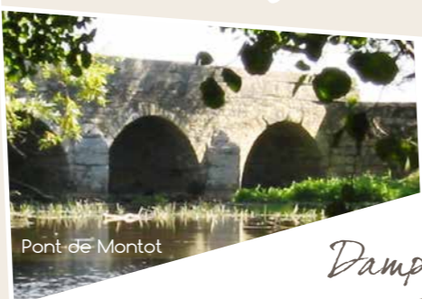
Pont de Montot